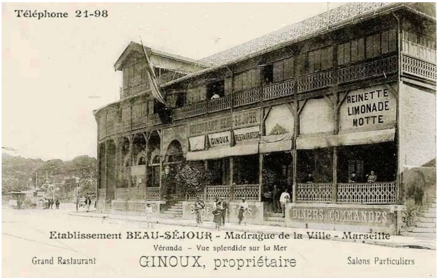
Chemin du Littoral – Établissement Beau-Séjour