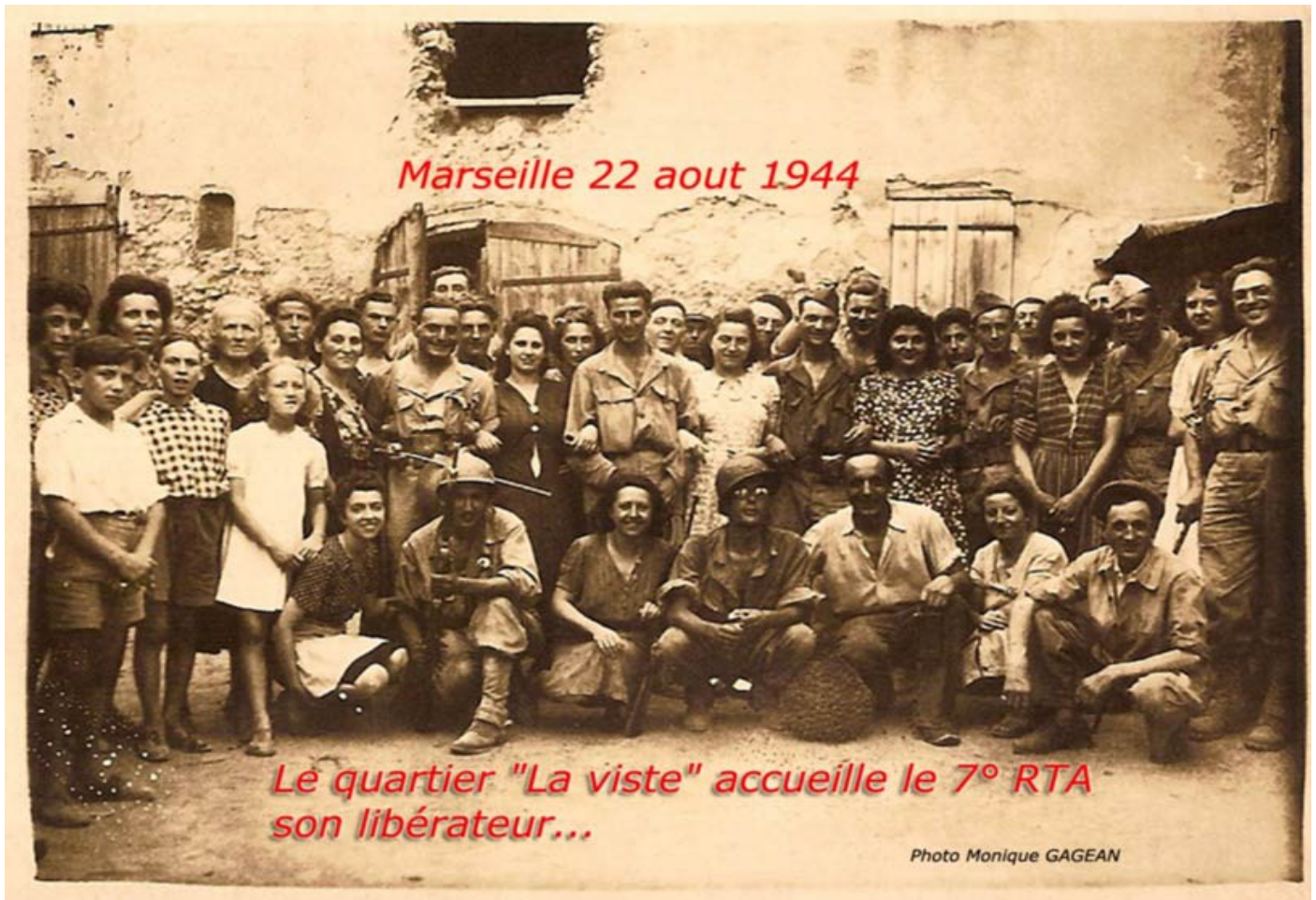
La Libération à La Viste