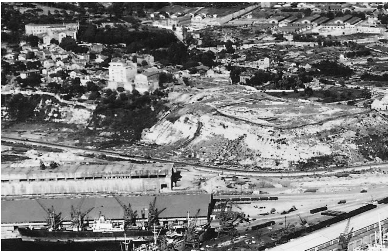
Cap Janet avant la construction de la cité de la Calade