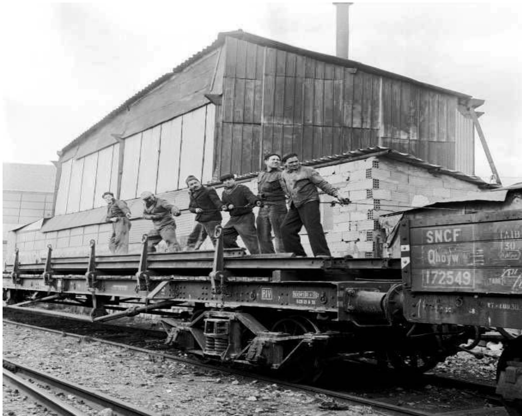
Dockers de Marseille (1955 – Henri Cartier Bresson)