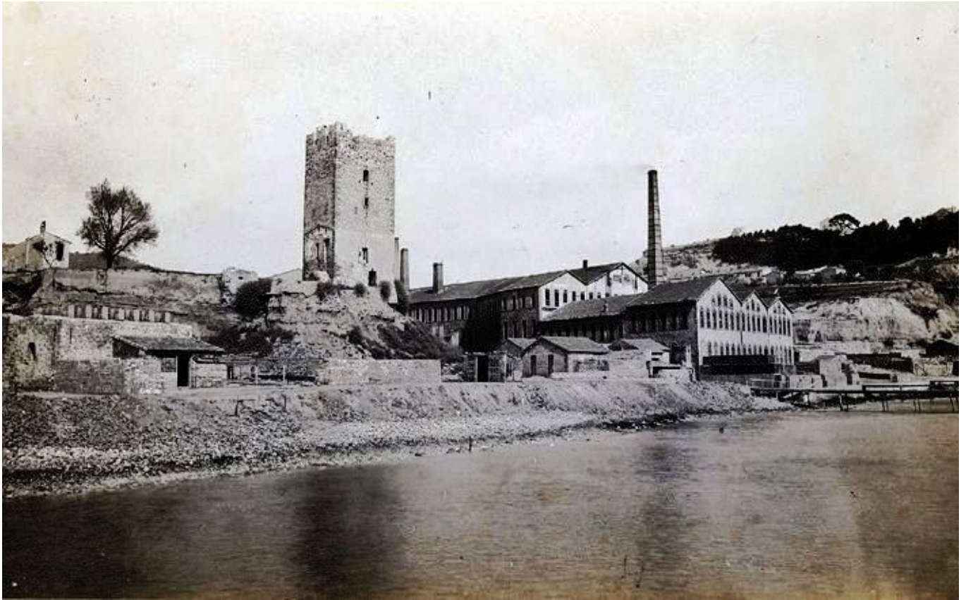
Tour Saumati (aujourd'hui criée)