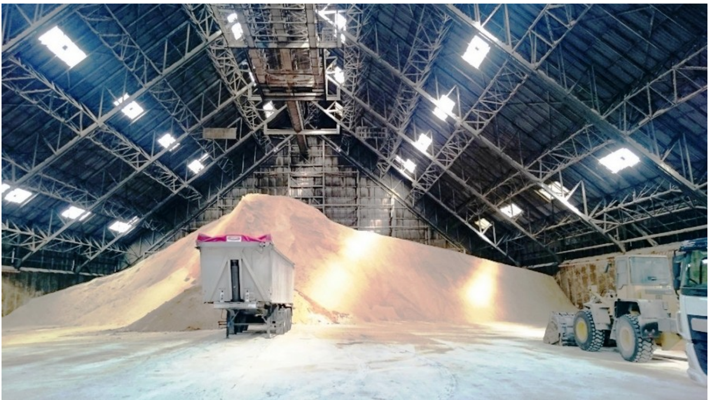
Silo à Sucre