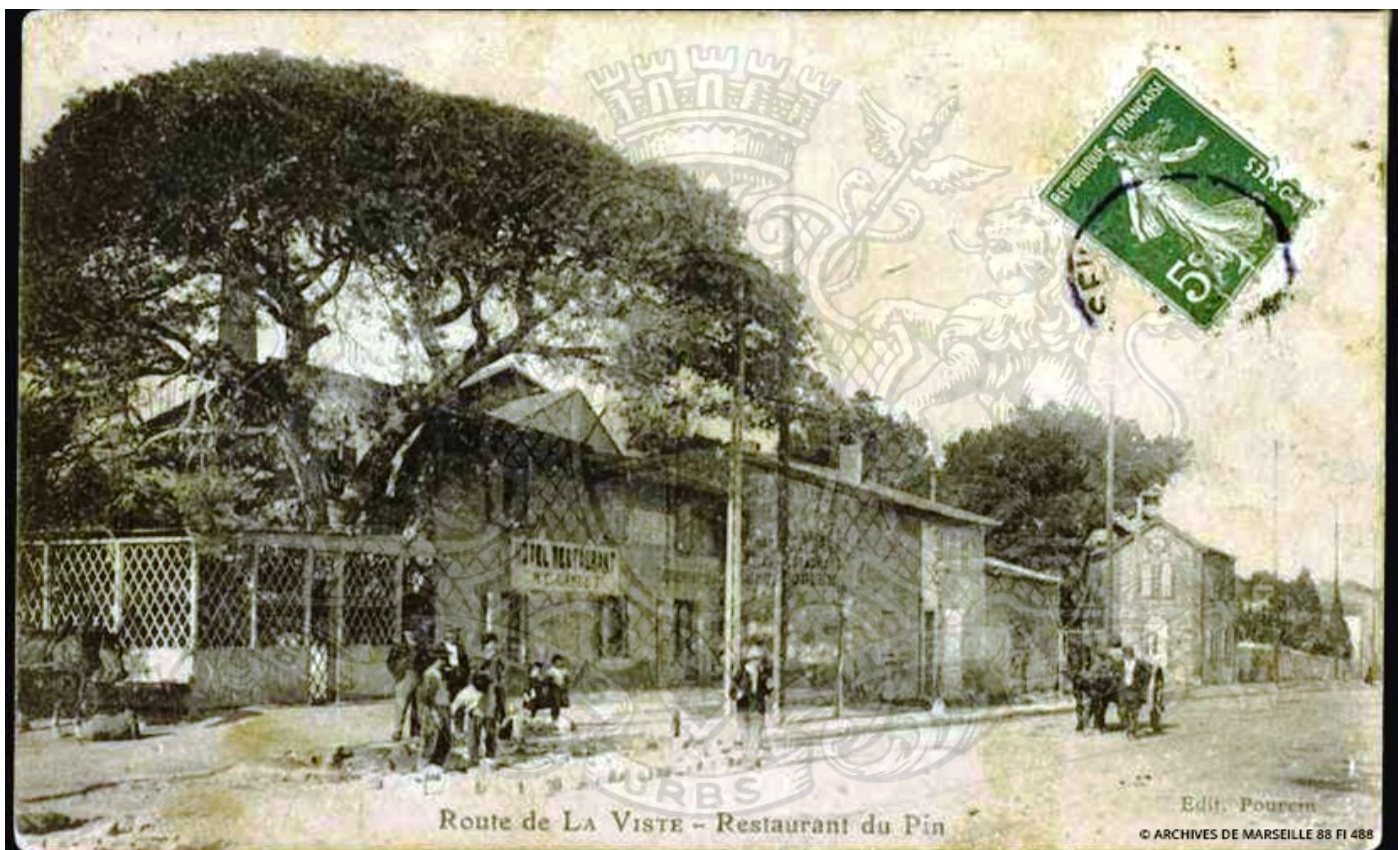
Route de la Viste