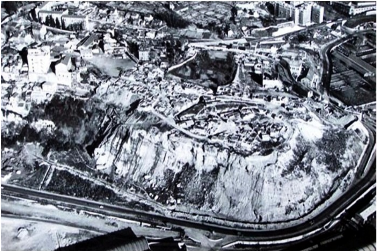
Cap Janet avant la construction de la cité de la Calade