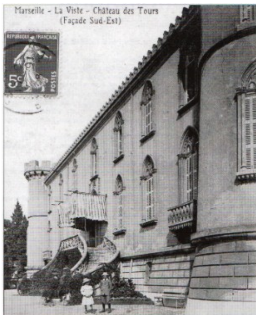
Château Foresta aujourd'hui Centre Commercial Grand Littoral