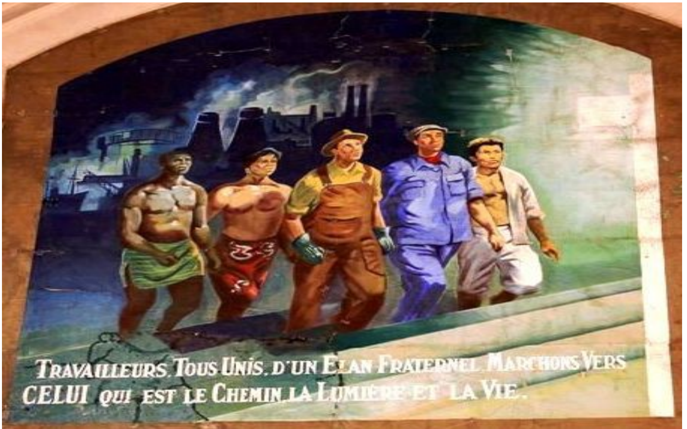
Fresque Église Saint-Louis