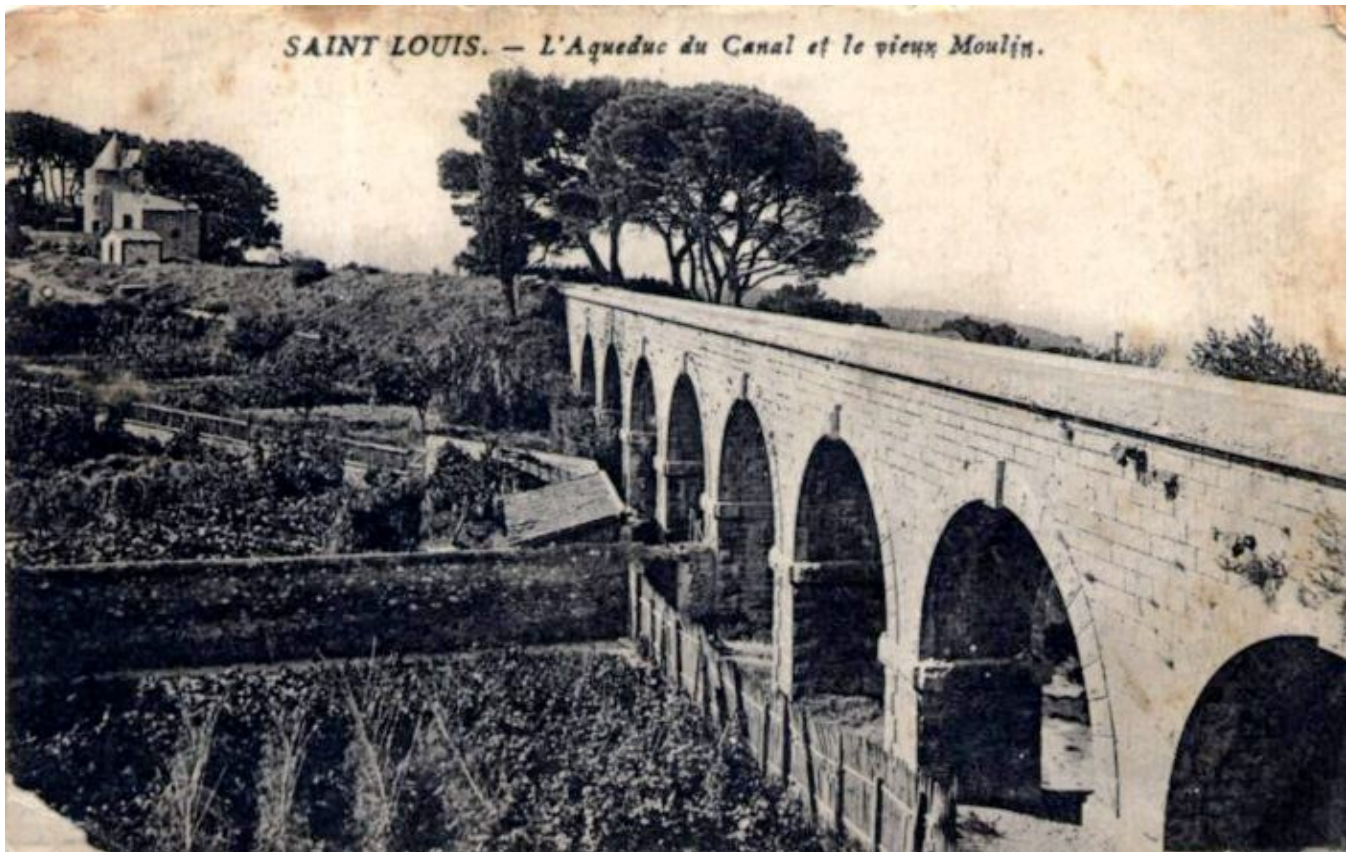
Canal de Marseille à Saint-Louis