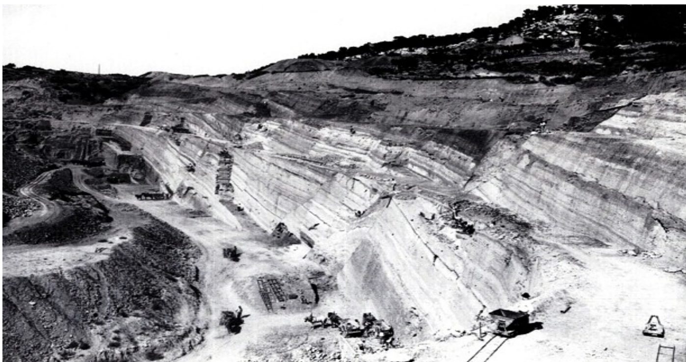
Carrière Foresta aujourd'hui Parc Foresta